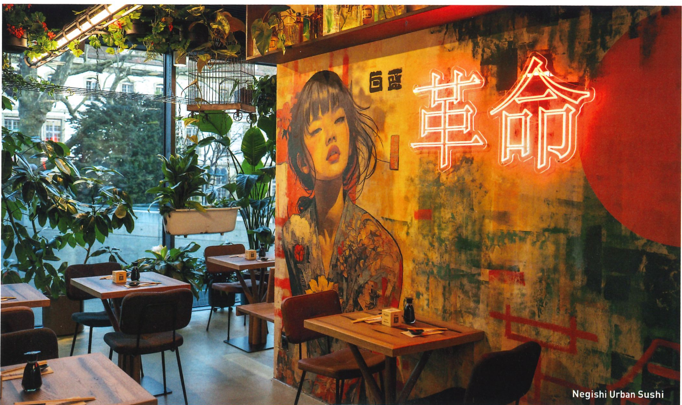
Negishi Urban Sushi